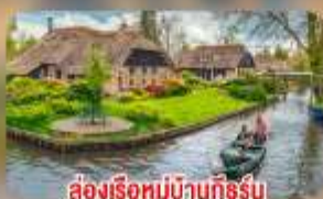
สองเรือหมู่บ้านทึร์น