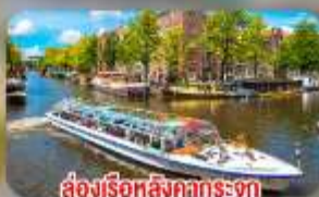
สองเรือหลังคากระจก