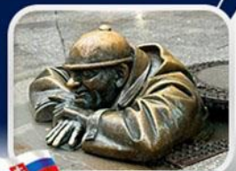
ประติมากรรม Cumil

บาเรียนพลาซซ์ • บ้านเกิดโมสาร์ท • พระราชวังฮอฟบวร์ก • ซาลส์บวร์ก • บ้านเกิดโมสาร์ท • เกรโกเดร์สตรีก • ทะเลสาบคอนิกซ์ • หมู่บ้านอัลลส์ตัทท์ • อนุสาวรีย์มาเรียเทเรซา