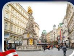
ซ็อบบิงการ์ทเนอร์สตรีท