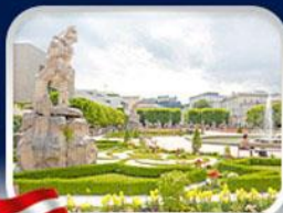
สวนมิราเบิล ซาลซ์บูร์ก