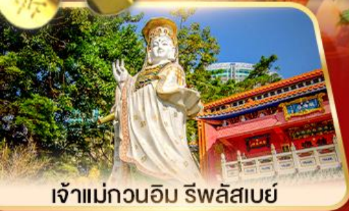
เจ้าแม่กวนอิม ธิพลสมัย