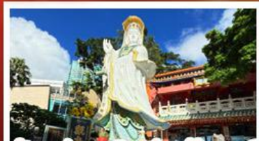
เจ้าแม่กวนอิมรัฟัสเบย์