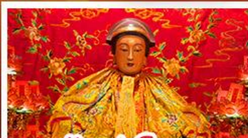
วัดเข่งไฉเมว