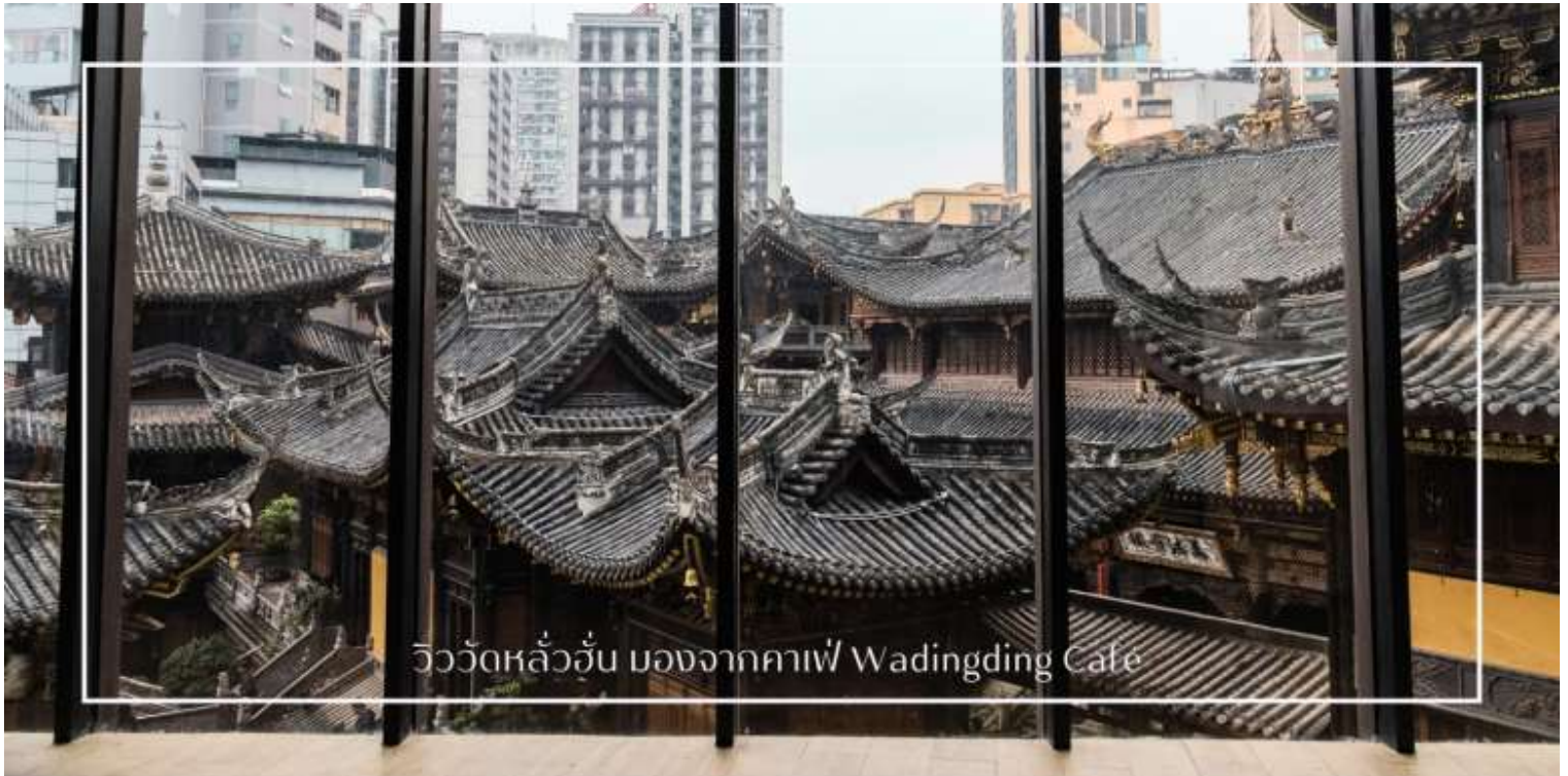
วิววัดหลัวฮั่น มองจากคาเฟ่ Wadingding Cafe

นำท่านสู่นำท่านเดินทางสู่ คาเฟ่ Wa Ding Ding Cafe สัมผัสประสบการณ์จับกาแฟในบรรยากาศที่ผสมผสานระหว่างโลกอนาคต และอดีต อย่างลงตัว บนชั้นดาดฟ้าตึก S95 ย่านเจียฟางเปย ไฮไลท์คือการชมวิว "วัดหลัวฮั่น"วัดเก่าแก่พันปีผ่านกรอบกระจกบานใหญ่ ที่ได้รับการขนานนามว่าเป็นหนึ่งในจุดถ่ายรูปลที่สวยงามที่สุดของมหานครฉงชิ่ง ให้ท่านได้เก็บภาพความประทับใจของหลังคาวัดสีทองอร่ามที่ตัดกับตึกสูงระฟ้าใจกลางเมือง พร้อมดื่มด่ำกับเครื่องดื่มที่รังสรรค์มาอย่างพิถีพิถัน