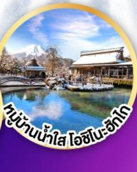
หมู่บ้านน้ำใส ไอชิโมะ-ซึกโก