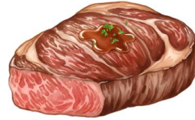
● เนื้อหมู