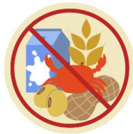
● แพ้อาหาร / อื่นๆโปรดระบุ