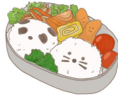
● อาหารสำหรับเด็ก ( 2-11 ปี ) *วัตถุดิบขึ้นอยู่กับทาว์ราน