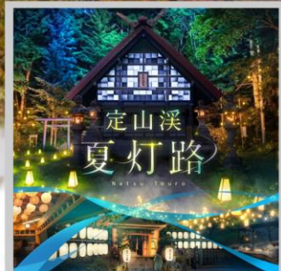
“JOZANKEI NATSU TOURO 2026”