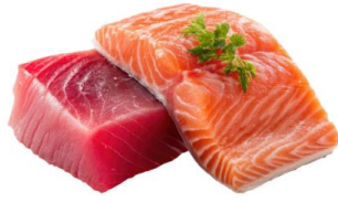
● เนื้อปลาดิบ