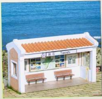
Tiaoshi Bus Station