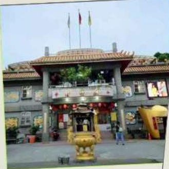
วัดจินซาน (โซกลาง)