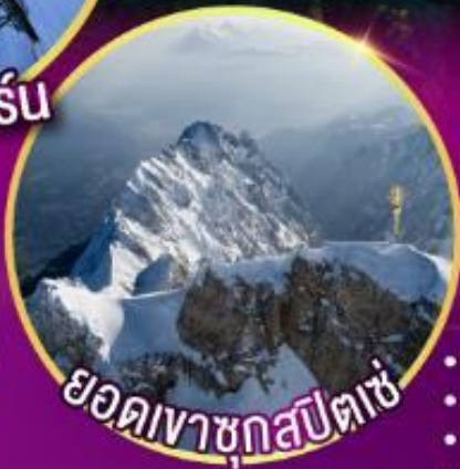
ยอดเขาชุกสปีตเซ