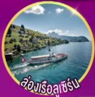
ล่องเรือลูเซิร์น