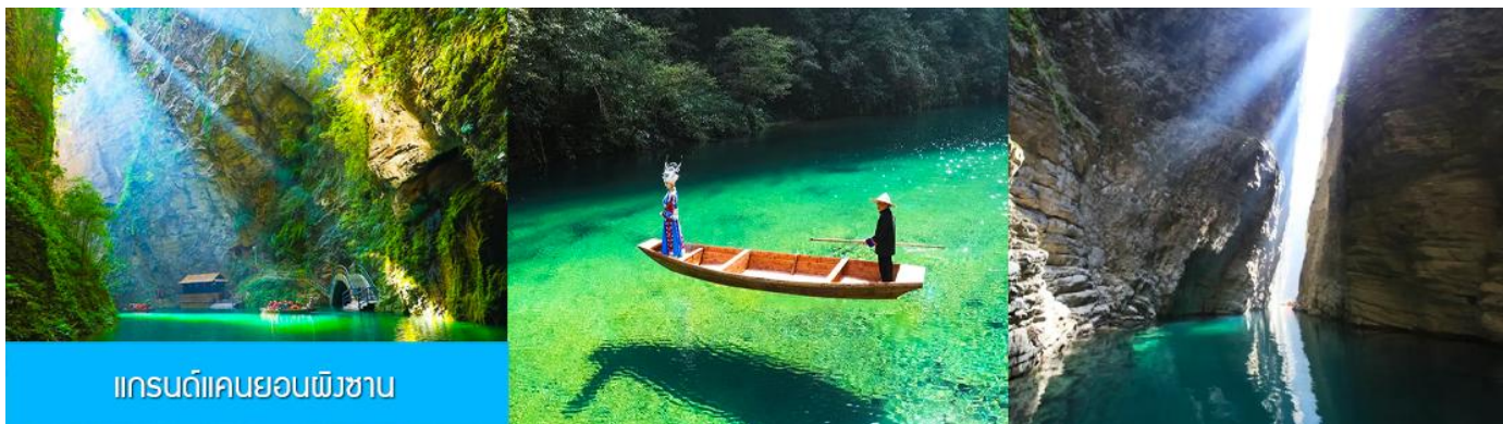
แกรนด์แคนยอนผิงซาน