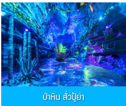
ป่าหิน ลั่วปู้ย่า

รับประทานอาหารเช้า ณ ห้องอาหารของโรงแรม (10)