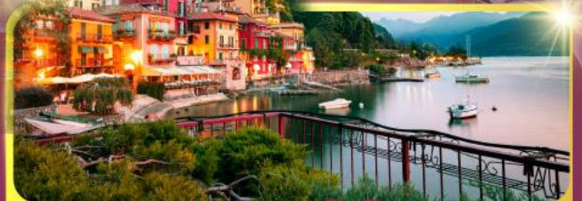
ทะเลสาบโลโบ