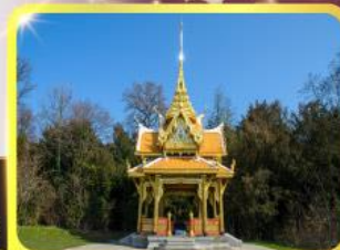
ศาลาไทยไชยานท์