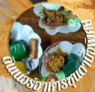
อาหารจานเดียวที่อร่อยที่สุด