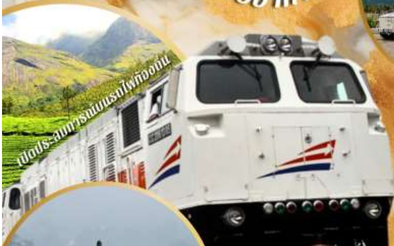
รถไฟสายมรดกโลก

มรดกยูเนสโก เทวสถานฮินดู สูงยิ่งใหญ่อลังการ