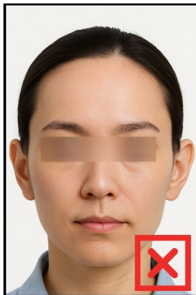
รูปที่ไม่ได้ขนาด ตามที่สถานทูตกำหนด