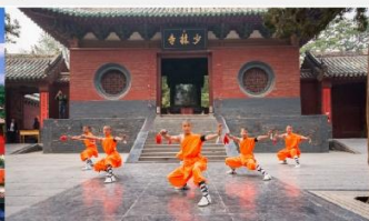
โชว์แสดงกังฟู