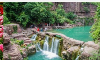
อุทยานหยุนโถซาน

*ทางบริษัทฯ ขอสงวนสิทธิ์ในการสลับโปรแกรมทัวร์ตามความเหมาะสมขึ้นอยู่กับสถานการณ์หน้างาน โดยคำนึงถึงผลประโยชน์ของลูกค้าเป็นสำคัญ