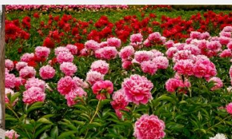
สวนดอกโบตั๋น