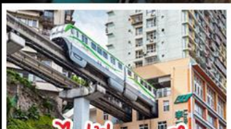
รถไฟไฟทะเลสาบ