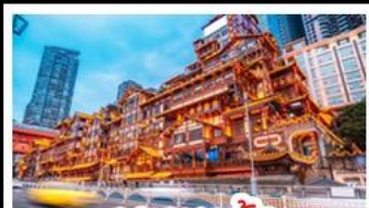
แสงเซาตัง