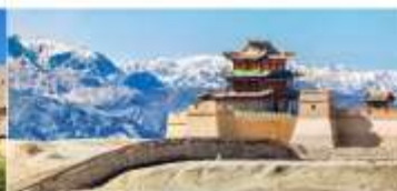
กำแพงเมืองจีน ด่านเจียอวี๋กวน

*ทางบริษัทฯ ขอสงวนสิทธิ์ในการสลับโปรแกรมทัวร์ตามความเหมาะสมขึ้นอยู่กับสถานการณ์หน่วยงาน โดยคำนึงถึงผลประโยชน์ของลูกค้าเป็นสำคัญ