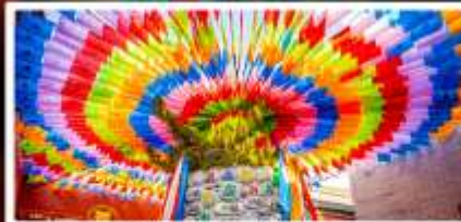
วัดลามะกว้างเหริน