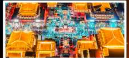
ถนนวัฒนธรรมต้าถิง