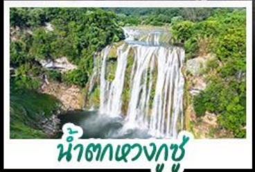
น้ำตกแขวงกู่