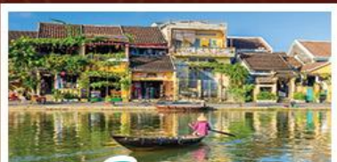
เมืองโบราณเฮออัน

! พักบนเขานาฮิลล์ 1 คืน ! สัมผัสอากาศเย็นตลอดปี สตรีตฟรังเศสสุดคลาสสิก - นั่งกระเช้ายาวที่สุด สู่มานาฮิลล์ สนุกสุดมันส์ไปกับสวนสนุก The Fantasy Park มนัสการเจ้าแม่กวนอิมองค์ใหญ่ที่สุดของเมืองดานัง - เช็กอินเมืองมรดกโลกฮอยอัน - สนุกสนานไปกับกิจกรรม!!นั่งเรือกระดิง หมู่บ้านกัมทาน เช็กอินร้านกาแฟ SON TRA MARINA CAFE - ไม่ลงร้านช้อปปิ้ง - อิ่มอร่อยกับบุฟเฟ่ต์นานาชาติ , หม้อไฟซีฟู้ด