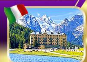
เช็คอินทะเลสาบมิทซ์นุ่มา