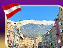
เที่ยวเมืองเก่า อินส์บรุค