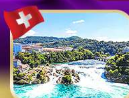
ชมความงดงาม น้ำตกไรน์