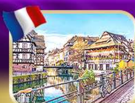
เที่ยวอัลซาส สตราสบูร์ก