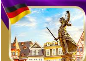
จัตุรัสไลเบอร์ตี แฟรงก์เฟิร์ต