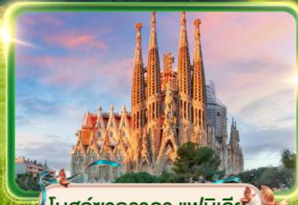
โบสถ์ซากราดา แฟมิลีย