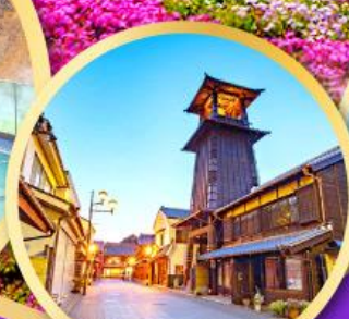
หอรบั้งโทคิโนะคาเนะ