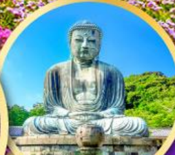
วัดโคโตคุอิน