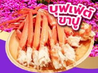
บุฟเฟ่ต์ ซาชิมิ