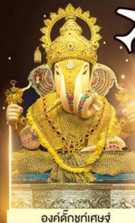
องค์ตั้งบูชท์พิเศษ