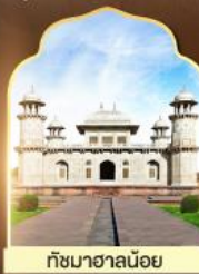
ถ้ำมาฆาลน้อย