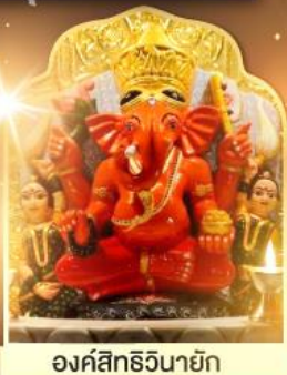
องค์สิทธินายิก