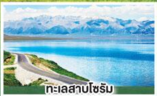
ทะเลสาบไซรัม