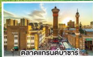
ตลาดแกรนด์บาซาร์