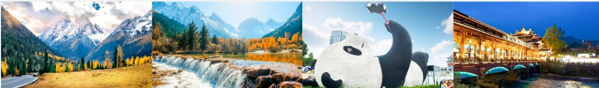
ภูเขาสีดรุณี (หุบเขาชวงเจียวโกว)