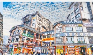
หมู่บ้านโบราณฉือซีไช่

*ทางบริษัทฯ ขอสงวนสิทธิ์ในการสลับโปรแกรมทัวร์ตามความเหมาะสมขึ้นอยู่กับสถานการณ์หน้างาน โดยคำนึงถึงผลประโยชน์ของลูกค้าเป็นสำคัญ