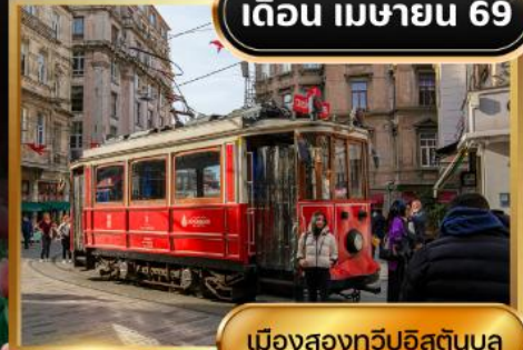
เมืองสองทวีปอิสตันบูล