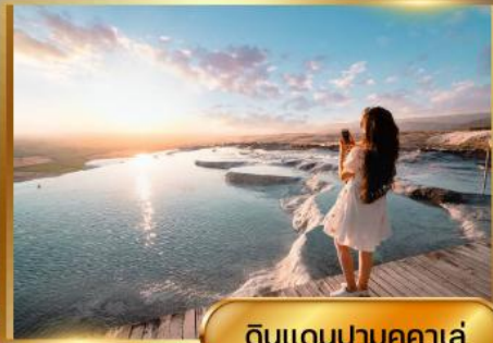
ดินแดนปามุคคาเล่