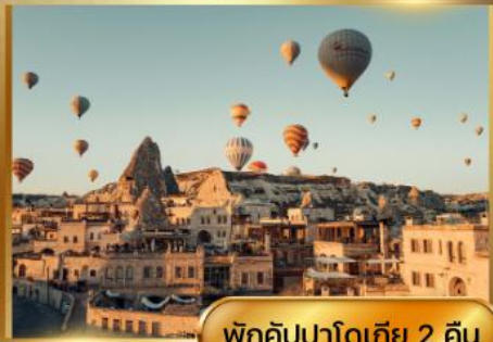
พักคิปปาโดเกีย 2 คืน