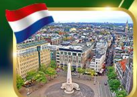
จัตุรัสดันสแควร์ อัมสเตอร์ดัม