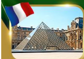
พีระมิดที่ลูฟวร์ ปารีส