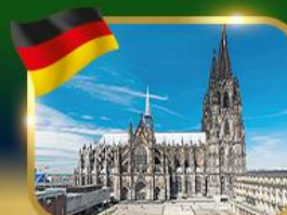
มหาวิหารแห่งเมืองโคโลญ