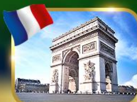
ประตูชัยฝรั่งเศส ปารีส