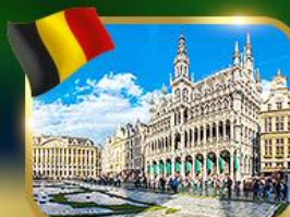
จัตุรัสกรอนด์ ปลาซ บริซเซลส์