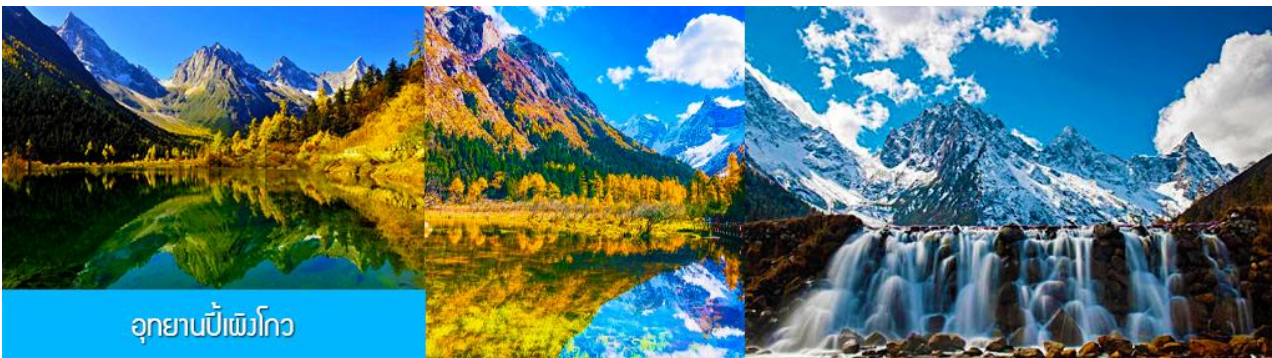
อุทยานปีเพิงโกว