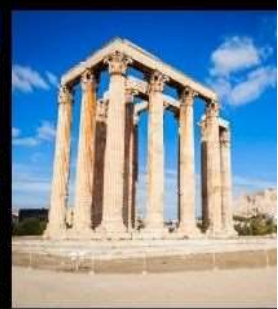
Temple Of Olympian