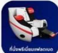
ที่นั่งพรีเมียมเฟลทเบด

บริการอาหารร้อน และ น้ำดื่ม บนเครื่อง ขาไป และ ขากลับ