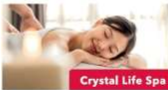
Crystal Life Spa