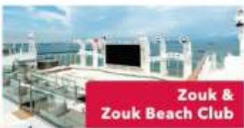
Zouk & Zouk Beach Club