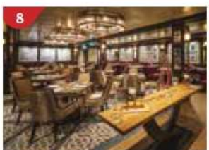
8 Bistro By Mark Best Relish contemporary Western cuisine from the internationally-acclaimed Australian chef.