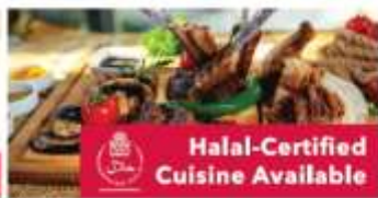
Halal-Certified Cuisine Available